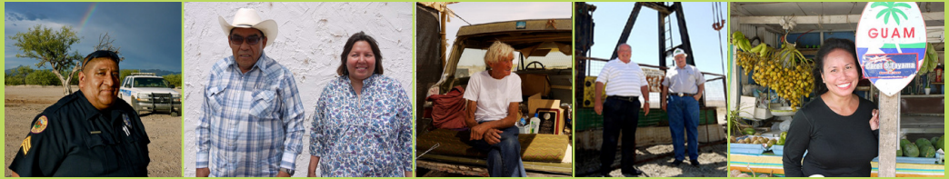
Para Arizona, California, Hawaii, Nevada, las Islas del Pacífico y 148 tribus

Agencia de Protección Ambiental de EE.UU. Suroeste del Pacífico/Región 9