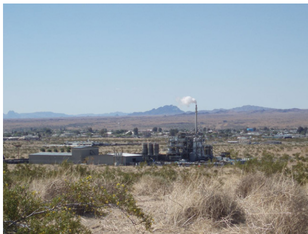
Fotografía de la planta

Evoqua opera una planta de regeneración de carbón ubicada en la reserva Colorado River Indian Tribes (CRIT) cerca de Parker, Arizona. El proceso de Evoqua implica tratar carbón usado en un horno de regeneración para purificarlo y ponerlo a disponibilidad para que se vuelva a utilizar en un producto comercial. El carbón usado que se envía a la planta ha sido utilizado para eliminar agentes contaminantes de emisiones de aire y agua contaminada en sitios industriales y sitios de limpieza en todo el país. La planta Evoqua recibe anualmente más de 5000 toneladas de carbón usado proveniente de 30 a 35 estados de todo los Estados Unidos. Cerca del 11% de este carbón usado se considera como deshecho peligroso y está regulado por la EPA.