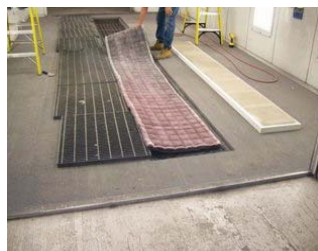
Piso de cabina con filtros sucios; Foto por Air Flow Technology,

La eficacia de las operaciones de la cabina, como también la calidad del resultado del retocado está afectado por los filtros de la entrada y el escape de aire (también referidos como filtros de partículas de pinturas). Cuando los filtros de entrada y escape están en buen estado, el aire fluye regularmente por la cámara de rociar y por la superficie de la