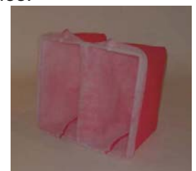
Pocket Cube Filter