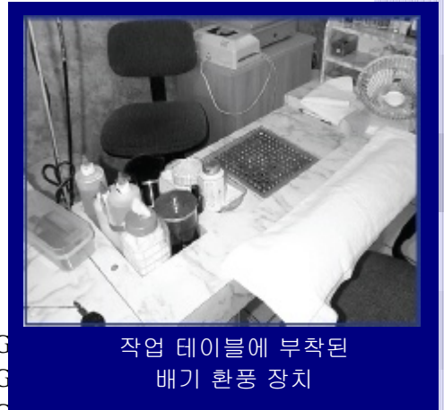
작업 테이블에 부착된 배기 환풍 장치

최 상의 업무 방법은 네일 관리사와 업주들의 근무 환경을 향상 시키고 제품의 노출을 줄이거나 최소화 하도록 돕는 것을 목표로 합니다. 이 책자의 내용이 각 주와 지역의 요구 조건과 다를 수 있으므로 여러분이 사는 지역의 미용업회나 각 주의 보건부에 연락하여 더 자세한 정보를 얻으십시오.